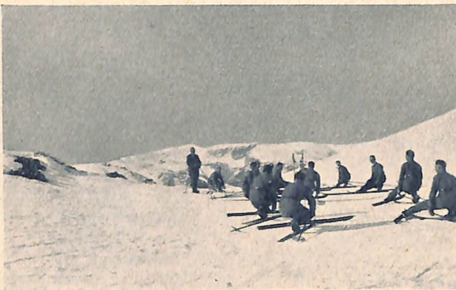
Übungen im Stembogenschifahren.

Die Gendarmerieakademiker, von denen etliche des Skilaufens unkundig waren, wurden im alpinen Skilauf (Anfängerkurs) ausgebildet. Außerdem erhielten sie eine theoretische Ausbildung durch Vorträge über folgende Themen: Die alpinen Gefahren im Hochgebirge, die Handhabung der Bußsole im Hochgebirge, das Anfertigen von Kursstizzen und Profils, die Behandlung der Skier, die Wache und ihre Anwendung.