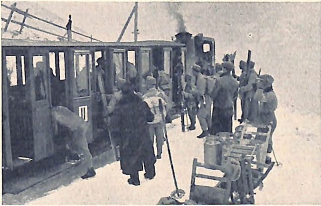
Abfahrt der Kursteilnehmer vom Baumgartnerhaus.

Rechts: Nun geht's nach Hause. Verladen der Stier in Buchberg zur Fahrt nach Mödling.