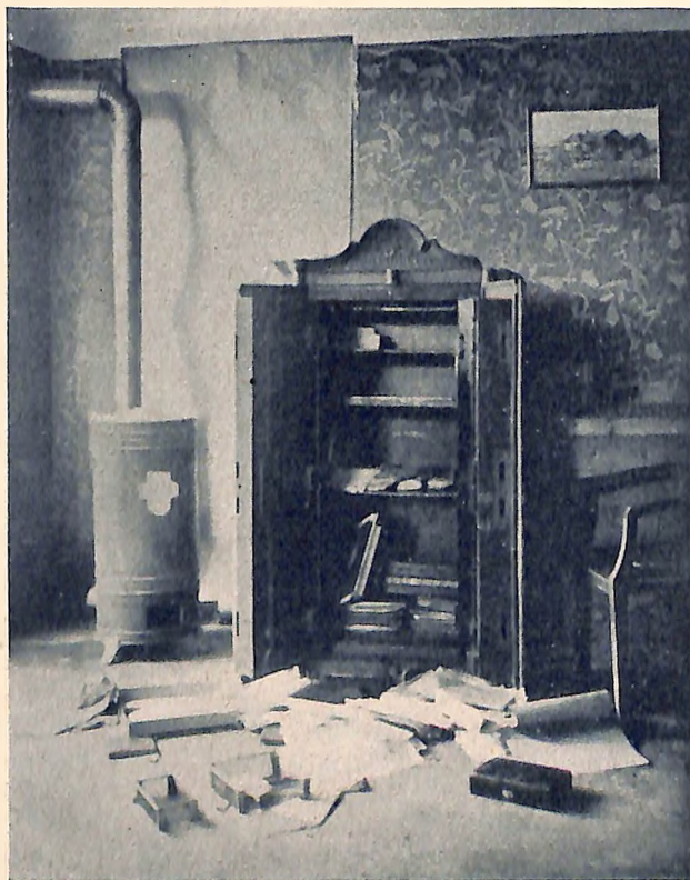
Die Situation vor der Kasse. Das dahinter befindliche Fenster mußte vom Lichtbildner abgedunkelt werden.