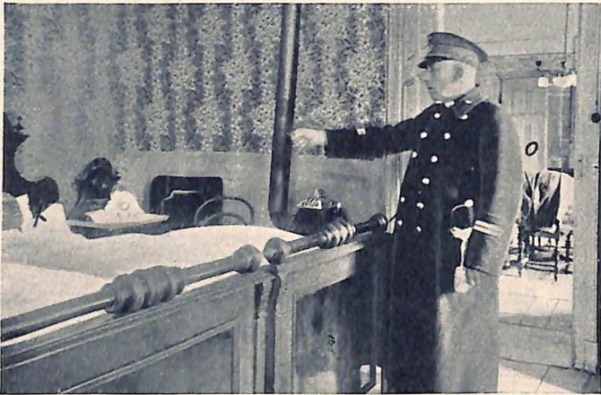
Der Standort des Täters zum Zeitpunkt, als er auf den im Bette liegenden Mühlenpächter schoß, wird durch einen Gendarmenriebeamteten rekonstruiert.