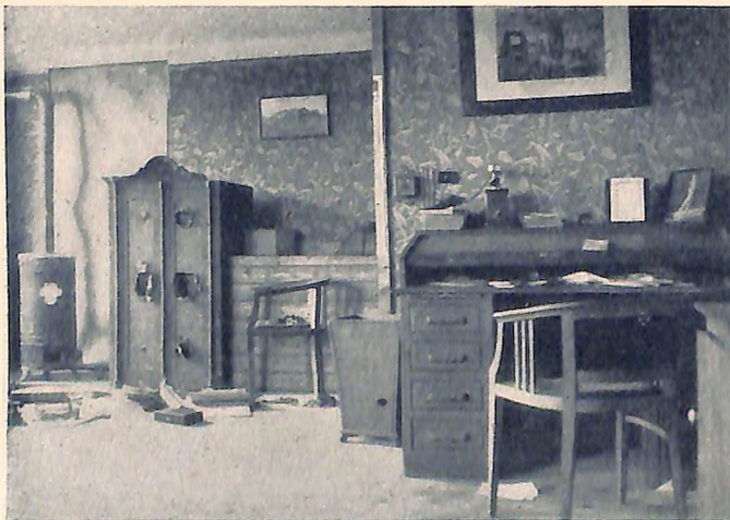
Gesamtüberblick. Die Kasse und der erbrochene Schreibtisch.

Kassenschränker an der Arbeit. — Nachts zum 5. April verübten bisnun unbekannte Täter im Schwadorfer Sägewerk bei St. Pölten (Nied.-St.) nach Aufsprengen einer Eingangstür und Aufsperrern der übrigen Türen einen Einbruch. Sie haben die eiserne Kasse durch Bloßlegen der Schlösser mit Reißwerkzeugen eröffnet und auch einen amerikanischen Schreibtisch aufgebrochen.