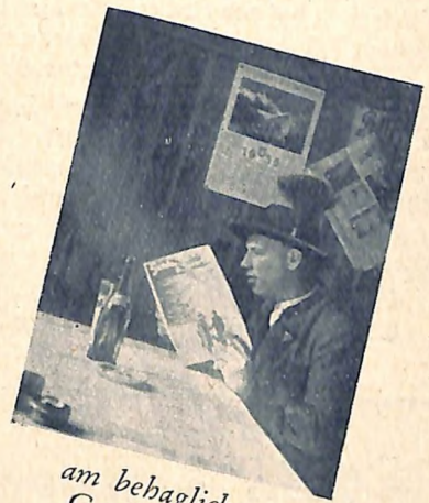
am behaglichen Gasthaustisch