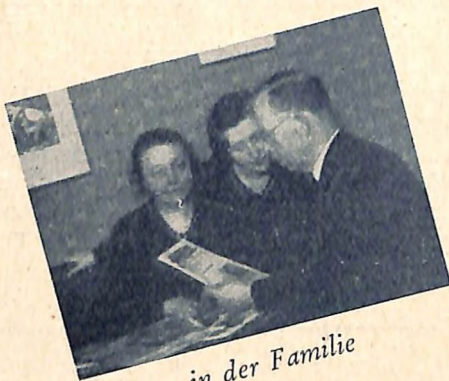
in der Familie