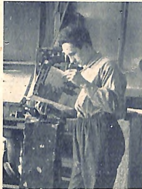
in der Werkstatt