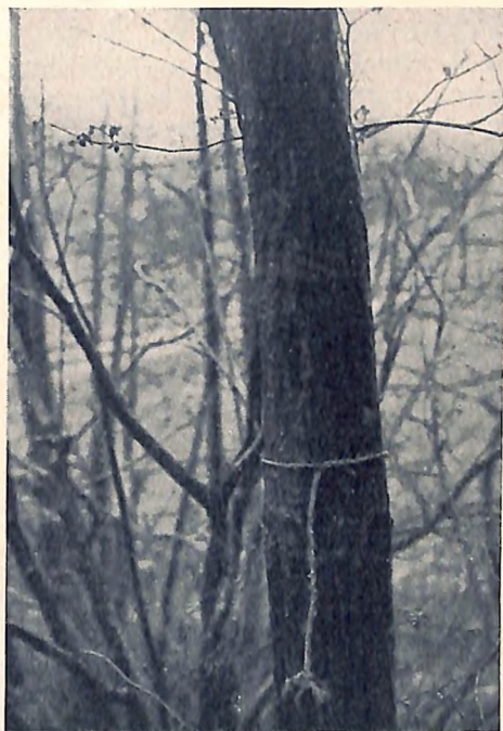
Mord in Göblasbruck (Niederösterreich). — Der Baum mit der darangebundenen Schnur. Mit dieser war das erdrosselte Opfer nachher aufgehängt worden, um einen Selbstmord vorzutäuschen. Die Schnur war nur um den Baum geschlungen, ein erstes Indiz, das gegen den Selbstmord sprach.

Ungefähr 200 Meter von der Haltestelle Göblasbruck und zirka 15 Meter vom Bahndamm entfernt lag an der Waldlichtung ein zirka 45jähriger Mann tot am Boden. Die Leiche war vollkommen bekleidet. 7½ Meter von ihr entfernt lagen auf der Wiese ein Rucksack und ein Aussenhut. Einige Meter im Waldinnern stand eine 10 Zentimeter starke Eiche, an der 90 Zentimeter über dem Erdboden ein Stück einer Rebschnur befestigt war. Die Rebschnur war einfach um den Baum geschlungen und ihr Ende zweimal durchgezogen. An ihr waren Blutspuren bemerkbar. Das andere Ende der Schnur war der Leiche mit einem festen Knoten um den Hals gebunden; es fehlte also die sonst übliche Schlinge. Aus den Ohren und der Nase des Toten war Blut getreten und die Augen waren stark gerötet. Die linke Halsseite wies eine Strangulierungsfurche auf, die