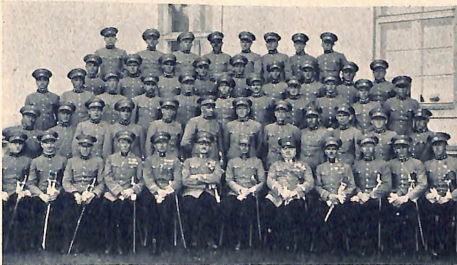
Kurs II der Gendarmerie-Anwärterenschule in Klagenfurt bei der Ausmusterung.