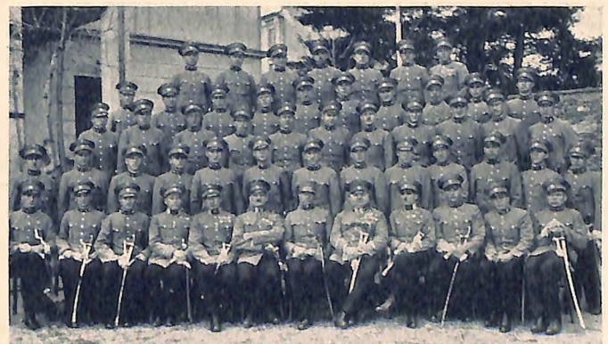
Kurs III der Gendarmerie-Anwärterenschule in Klagenfurt bei der Ausmusterung.