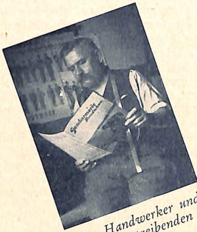
beim Handwerker und Gewerbetreibenden

Sie ist ein gern gesehener Gast, ein viel gelesenes Blatt