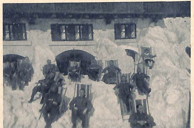
Sonnenbad während der Mittagsrast. Nach der vormittägigen Anstrengung eine wohlige Entspannung in der wärmenden Sonne.