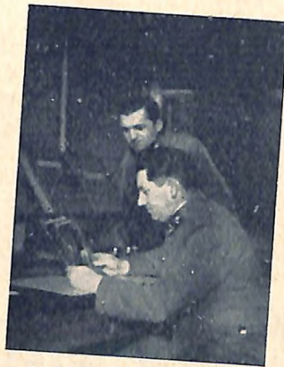
bei den Gendarmen