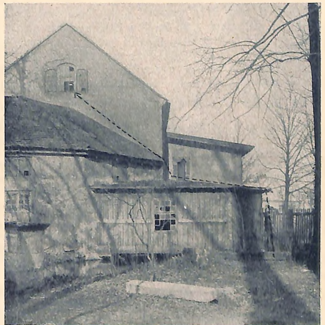
Die Mühle in Pottendorf, in der ein Raubmordversuch auf den Pächter unternommen wurde. Der Weg, den der Täter genommen hat, um in das Gebäude zu gelangen, ist eingezeichnet.

Der Mühlenpächter, seine Gattin und Tochter, sowie deren Bräutigam, der zu Besuch gekommen war, hatten bis gegen 22 Uhr im Speisezimmer verweilt. Um diese Zeit verabschiedete sich der Bräutigam, den die Tochter des