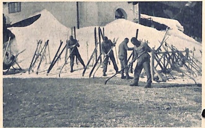
Beim Skiwachseln vor dem Hotel Hochschneeberg.