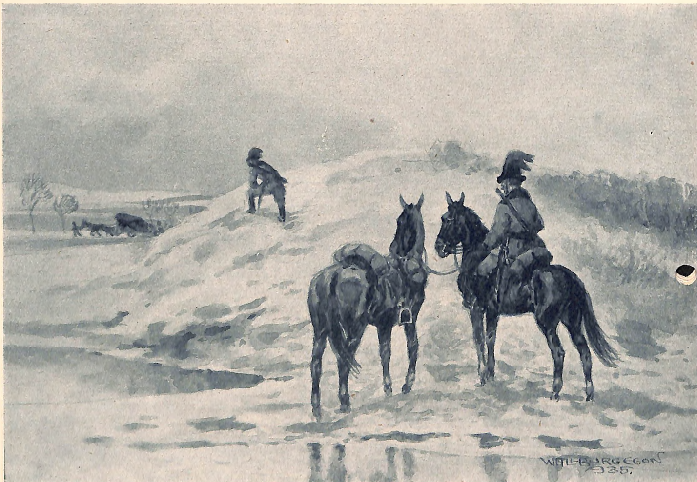
Eine berittene Gendarmeriepatrouille.