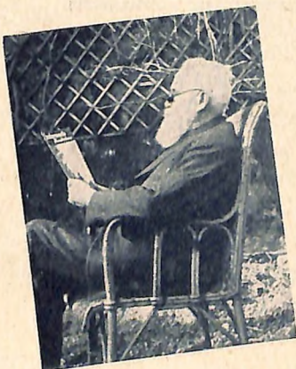
bei Alt und Jung!