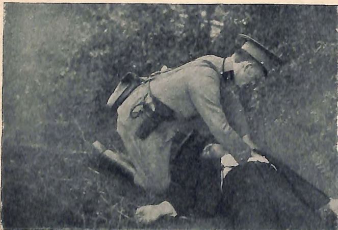
Auffindung eines Leichnams. — Der Gendarm ist allein, er kann nicht wie die Sicherheitswachebeamten in den Landeshauptstädten auf rasche und ausgiebige Assistenz rechnen. Er muß nun all die vielen kriminalistischen Ratschläge, die bestehenden Vorschriften und Gesetze beachten...