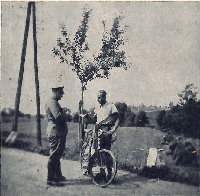
Kontrolle eines angehaltenen Radfahrers. Die Gründe zu einer solchen Anhaltung können sehr mannigfaltig sein.