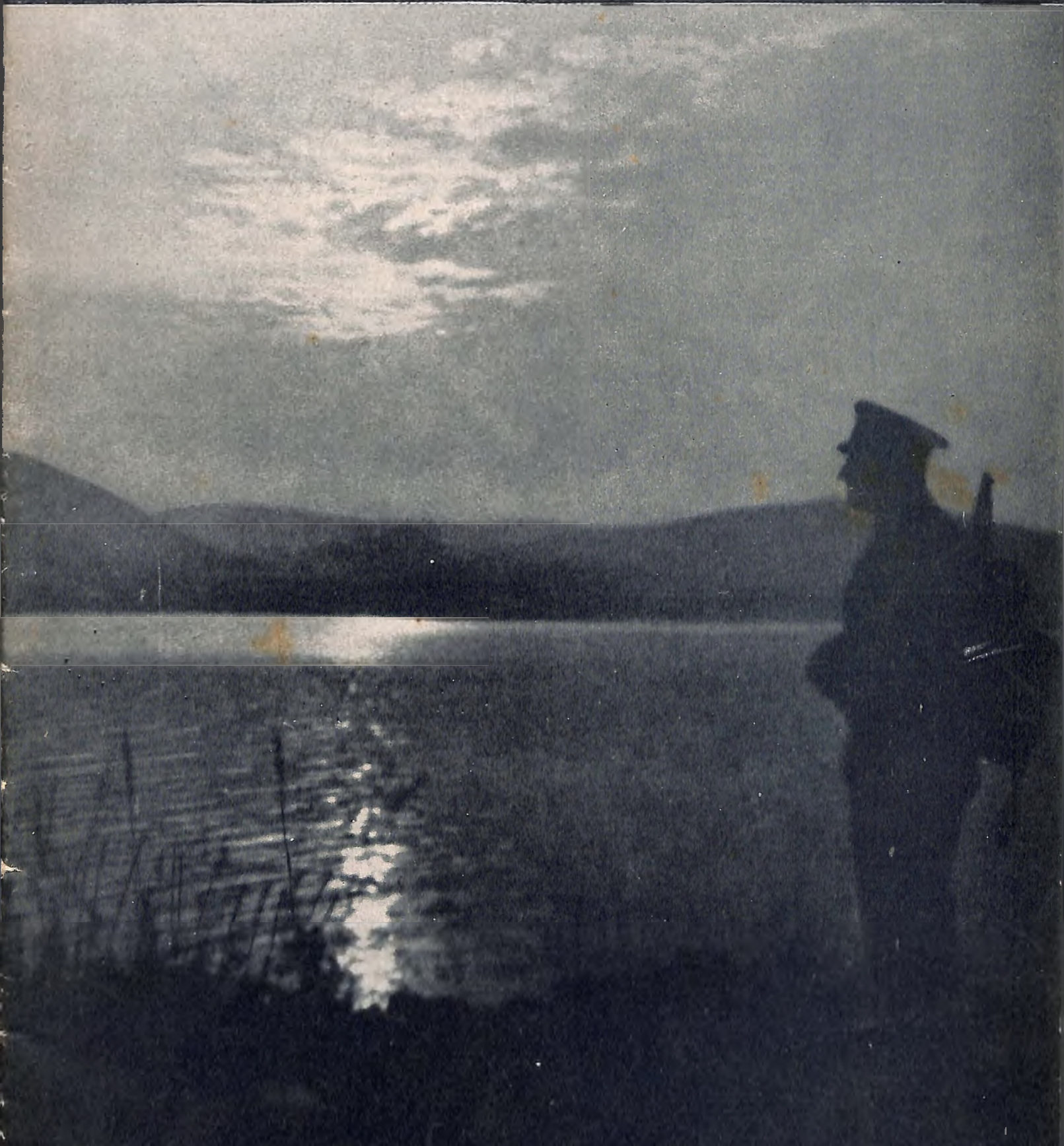
Abend am Traunsee