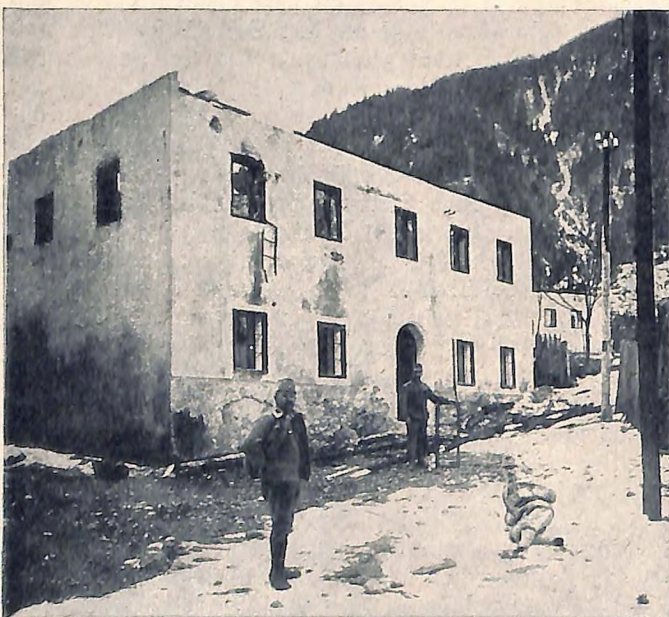
Die ehemalige k. k. Gendarmeriekaserne des Postens Nr. 13 in Wolfsbach in Kärnten nach der Beschädigung am 16. September 1915 durch die Italiener.