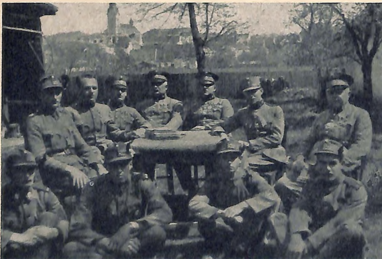
Postenschule im Freien anlässlich der Visitation eines Gendarmeriepostens durch den bereisenden Abteilungskommandanten, Stabsritztmeister Pachernigg.

So haben wir uns halt mehrmals in der Nacht in der Umgebung des oberen Hinterladner-Hofes auf Vorpaß gelegt. Was gekommen ist, das waren ab und