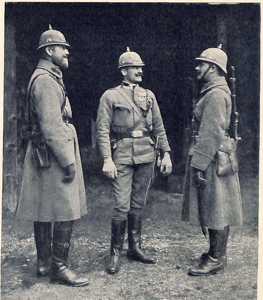
Während des Weltkrieges wurden an die Gendarmerie und besonders an die Feldgendarmarie die härtesten Anforderungen gestellt. Hierüber berichten wir in einem der folgenden Hefte.