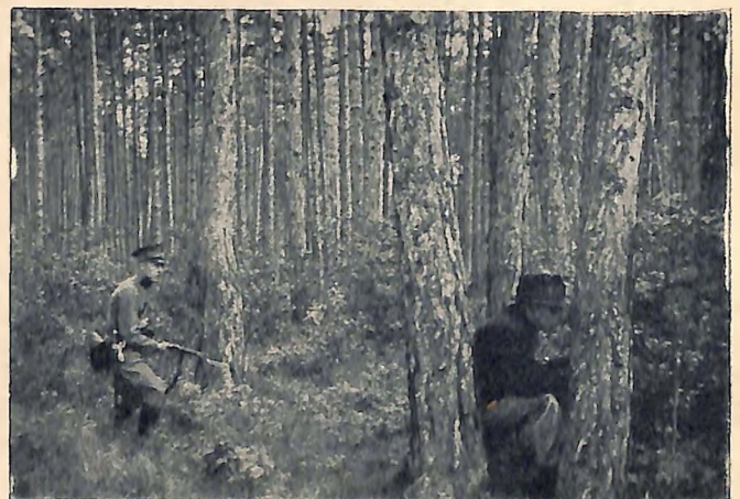
Überraschung eines Wildererers, der Wildschlingen ausgelegt hatte und außerdem auf das Erscheinen eines kapitalen Bodes wartet. Im nächsten Augenblick erfolgt der Anruf des Gendarmen und dann...